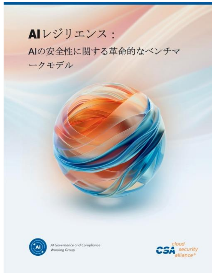
AI Resilience: A Revolutionary Benchmarking Model for AI Safety AIレジリエンス：AIの安全性に関する革命的なベンチマークモデル