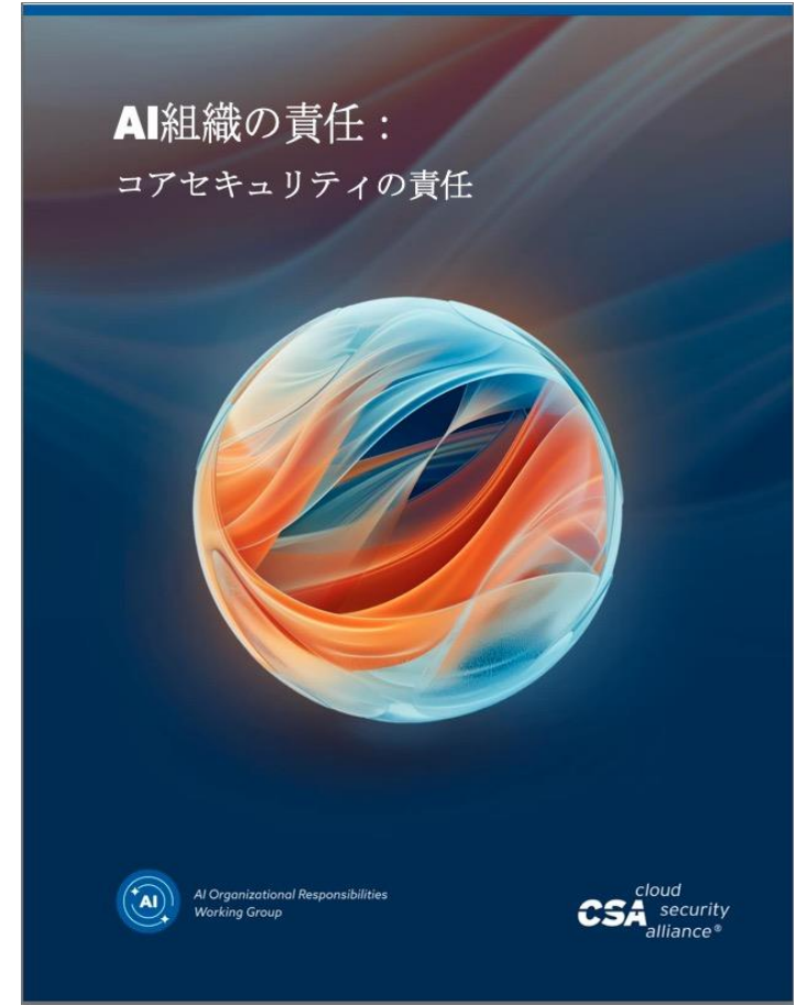
AI Organizational Responsibilities - Core Security Responsibilities AI組織の責任：コアセキュリティの責任